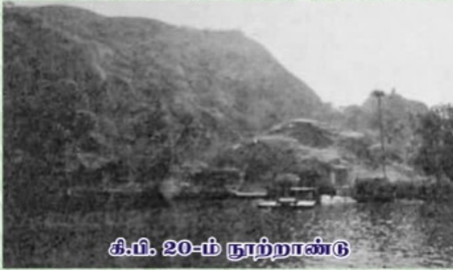
கி.மீ. 20-ம் நூற்றாண்டு